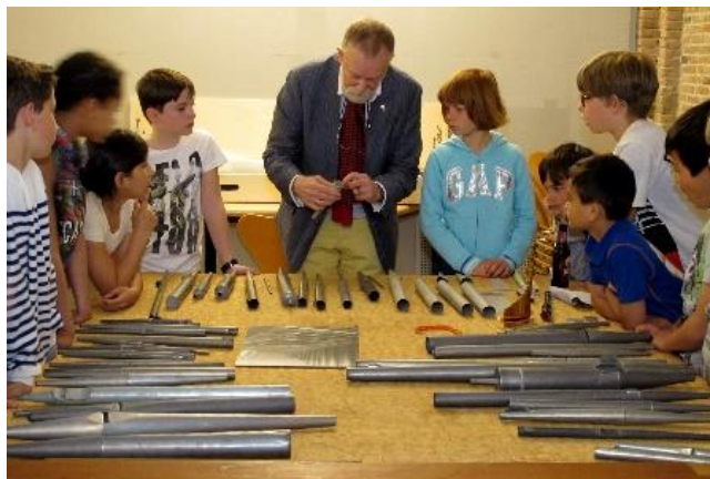
'Kijk zo worden orgelpijpen gemaakt...'