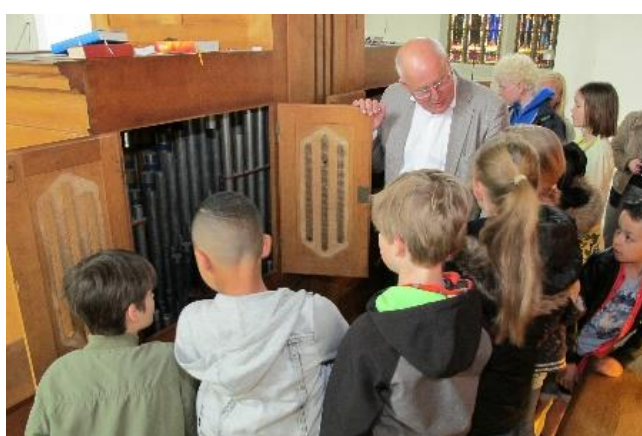
Kijken achter de deurtjes van het 'Rugwerk'