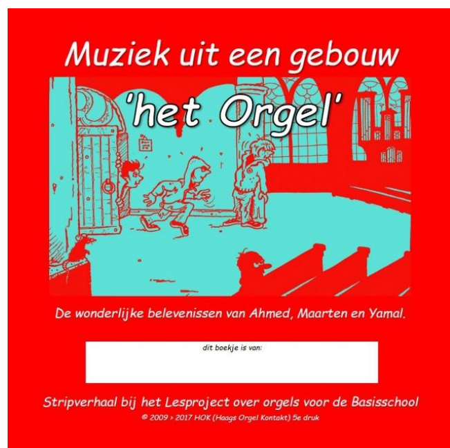
Lesboekje 'Muziek uit een gebouw'-het orgel-

Er wordt vanuit gegaan dat de deelnemende leerlingen het lesmateriaal zelf houden, zodat het nog eens ingezien kan worden. Bij herhaling van deelname van de school wordt nieuw lesmateriaal geleverd door het HOK.