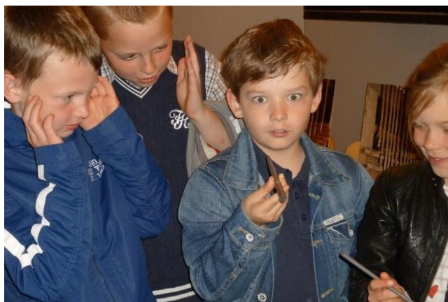
Zo'n klein pijpje klikt wel heeeeel hoog!