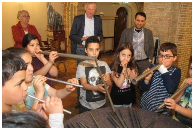
Ook de orgelpijpen moet je uitproberen...