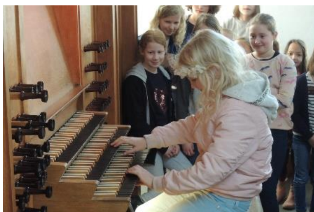
Natuurlijk mag je het ook zelf proberen...