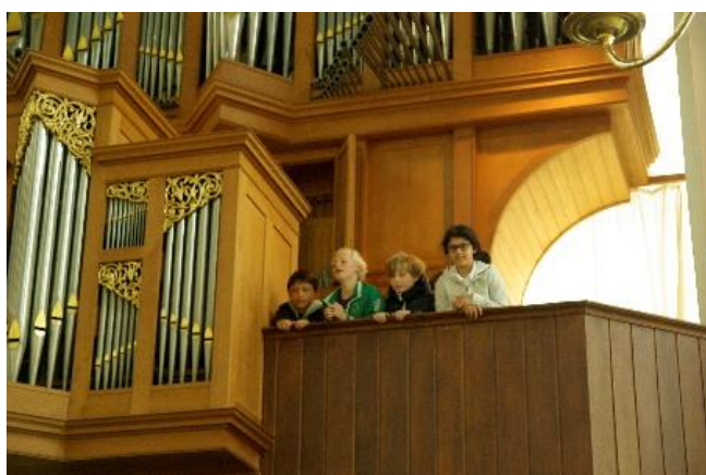
Bij het orgel kan je veel zien...