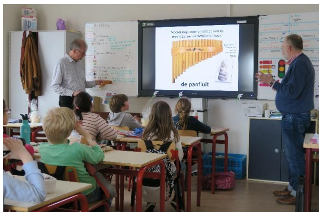
Eerst is zijn er de (gast)lessen in de klas