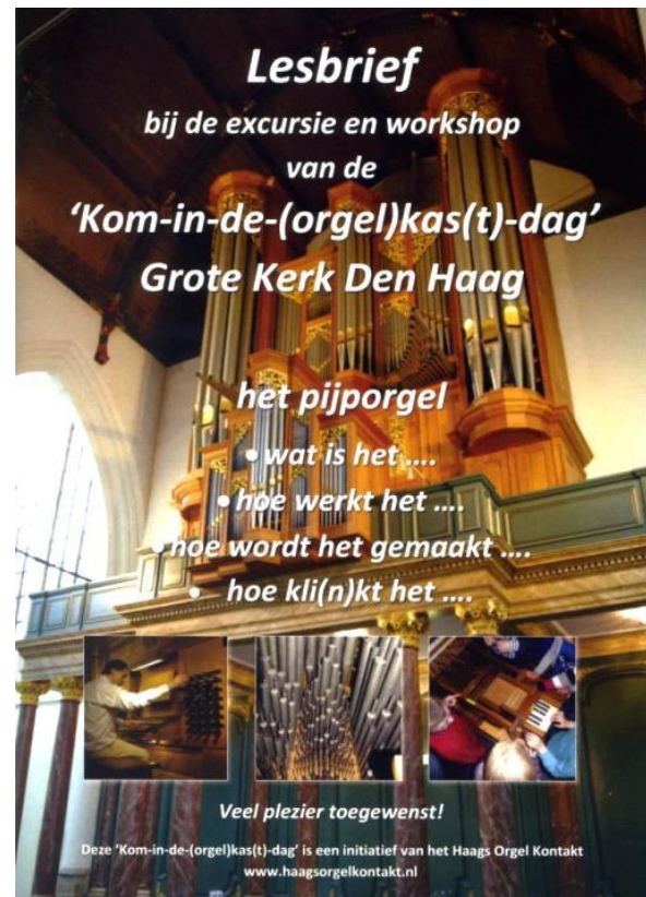
Flyer, Introductie-vouwblad en Lesbrief van de 'Kom-in-de-(orgel)kas(t)-dag' in de Grote Kerk