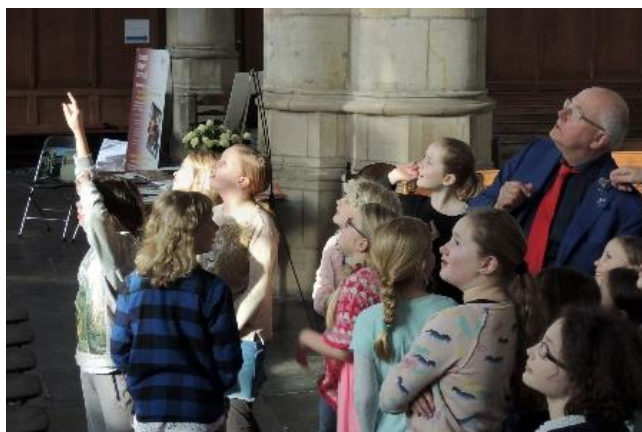
'Kijk daar staat het orgel'