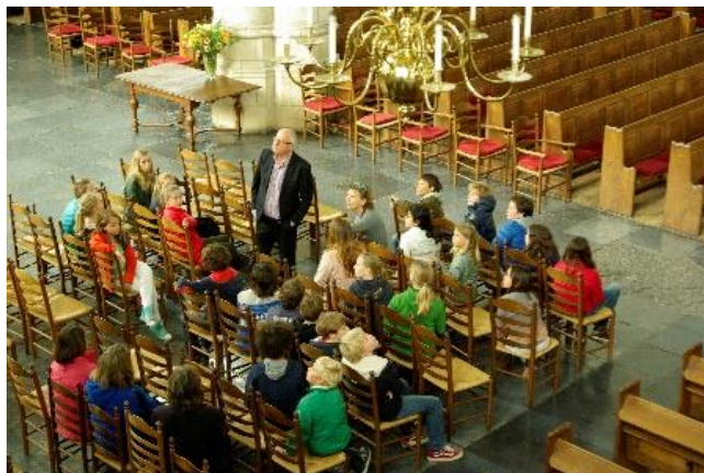
Met de klas in de Kloosterkerk