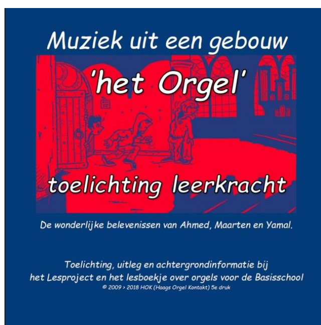
'Toelichting bij de les' voor de leerkracht